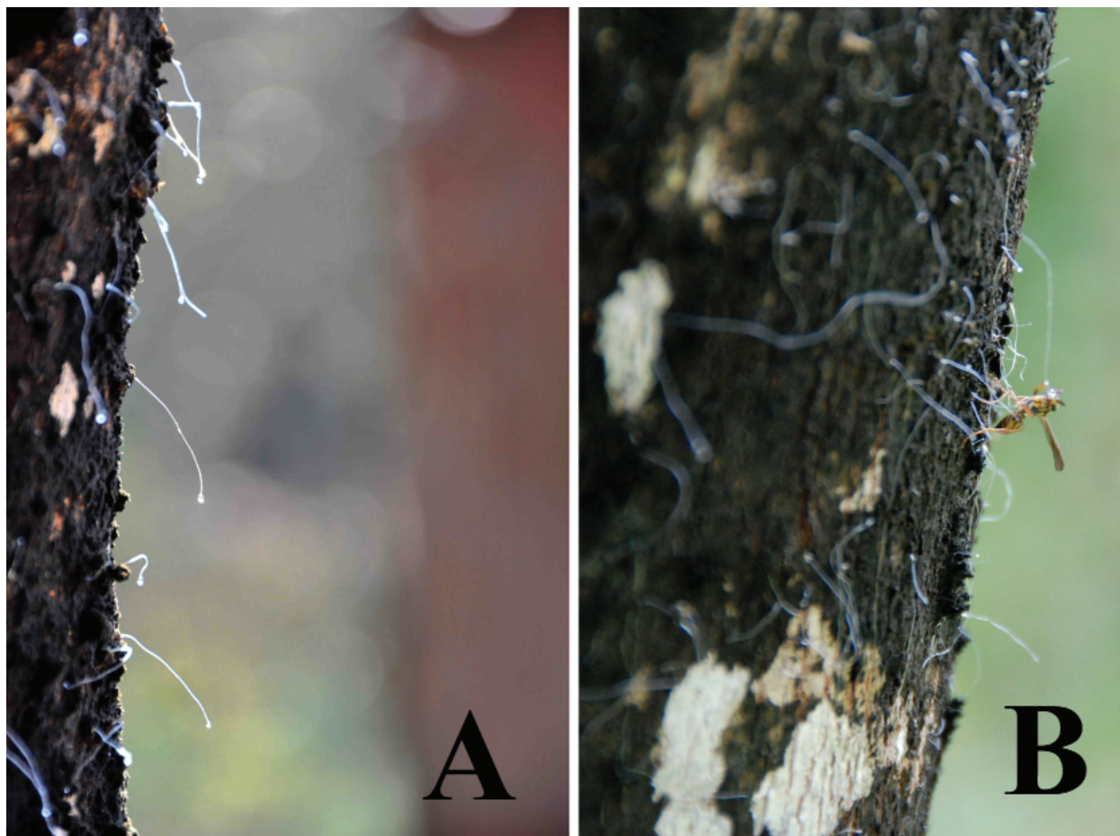
Figura 1. Stigmacoccus paranaensis en tronco de M. scabrella . A. Pelos blancos largos que parten de los quistes. B. Himenóptero alimentándose de mielato, exudado del insecto escama.