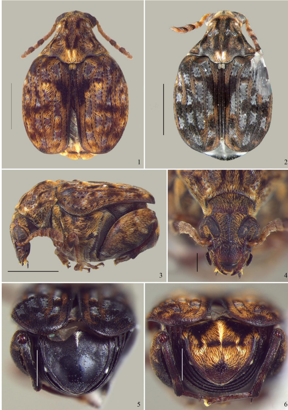
Figs. 1-6. Gibbobruchus bergamini Manfio & Ribeiro-Costa sp. nov. 1. Male dorsol habitus; 2. Female dorsol habitus; 3. Male lateral habitus; 4. Male head, frontal view; 5. Female pygidium; 6. Male pygidium. Scale: 1-3. 1 mm; 4. 0,25 mm; 5-6. 0,5 mm.