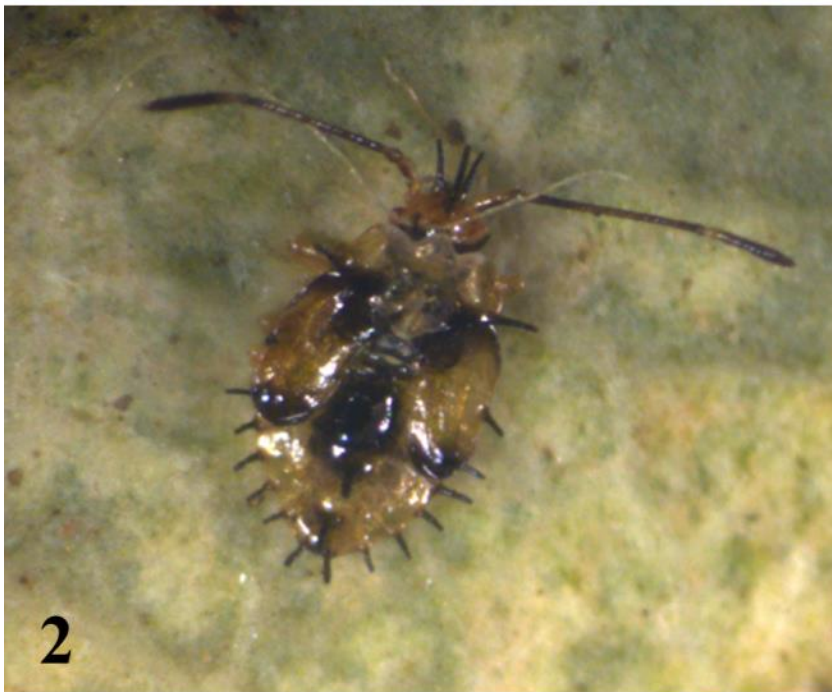
Figs. 1, 2. Stephanitis blatchleyi (Hemiptera: Tingidae) on its host plant, Lyonia ferruginea (Ericaceae). 1: Adult. 2: Last-instar nymph.