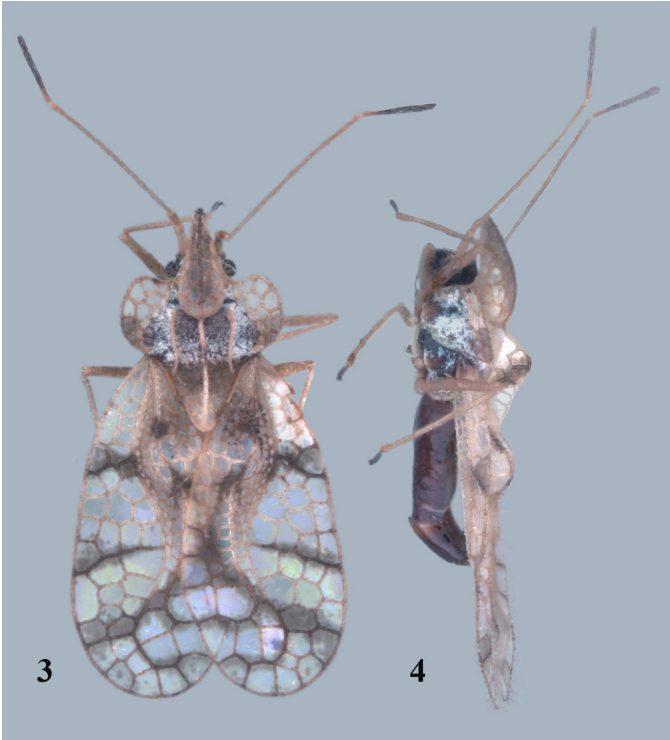
Figs. 3, 4. Stephanitis blatchleyi : Florida, Clay Co., Jennings State Forest, ca. 8.5 km N of Middleburg, 10 March 2008. 3: Dorsal view. 4: Lateral view.