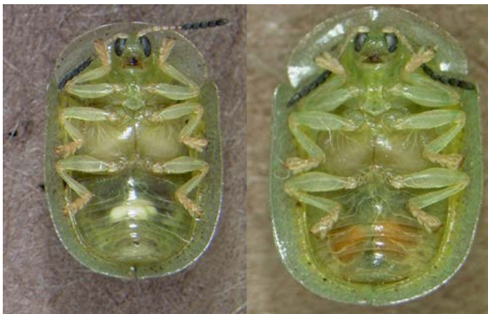
Figura 7. Hembra (izquierda) y macho (derecha) de Gratiana boliviana ; nótese los oviductos blancos y los testículos anaranjados.

Los machos y hembras en estado reproductivo pueden ser reconocidos al observar la parte ventral del abdomen. Dos testículos anaranjados son visibles a través del integumento de los machos, mientras que los oviductos blancos pueden ser visibles en las hembras.