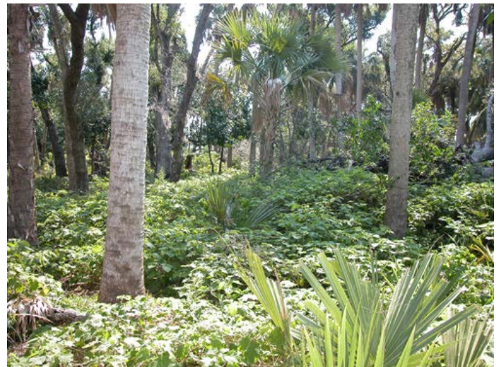
Figura 1. Una infestación de tropical soda apple en el condado de St. Lucie, Florida. Abril 2006.

El crisomélido de tropical soda apple, Gratiana boliviana Spaeth, fue descubierto en Paraguay y posteriormente importado a los Estados Unidos para evaluar su potencial como agente de control biológico. Pruebas de especificidad revelaron que Gratiana boliviana solo se alimenta y completa su desarrollo en tropical soda apple, por lo tanto, su liberación fue aprobada en el año 2003. Varias instituciones participaron en la cría masiva, distribución, y liberación de más de 250,000 escarabajos a través de Florida desde el 2003 al 2011.