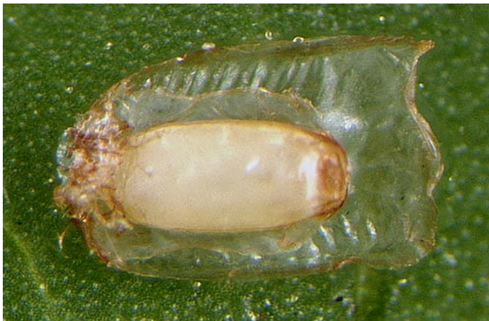
Figura 3. El huevo de Gratiانا boliviana .

Los huevos son de 1 a 1.8 mm de largo, cafés y rodeados por una membrana fina.