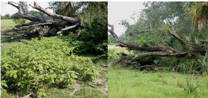
Figura 9. Un pastizal antes y después de la liberación de Gratiana boliviana , condado de St. Lucie, Florida.

Estudios realizados en pastizales del centro de Florida demostraron que Gratiana boliviana reduce drásticamente la densidad de tropical soda apple en menos de un año de su liberación, aunque en algunos sitios podría tomar más tiempo. Gratiana boliviana no elimina completamente la maleza de un área infestada pero reduce la densidad de tropical soda apple a niveles más tolerables. En algunos casos, control biológico deberá ser complementado con herbicidas y chapeadoras, especialmente durante los meses de invierno cuando los escarabajos no están activos, y en el norte de Florida donde el impacto de los escarabajos es menor.