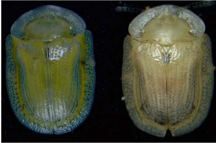
Figura 6. Adulto reproductivo (izquierda) y adulto en diapausa (derecha) de Gratiana boliviana .

Los adultos miden 6 mm de largo y de 4 a 5 mm de ancho. El color de los adultos varía según su estado reproductivo; adultos reproductivos son verde intenso mientras que los adultos en diapausa (estadio de invernación) son de color café pálido.