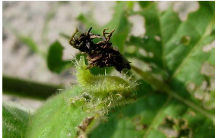
Figura 4. La larva de Gratiانا boliviana ; nótese el excremento y las mudas.

Las larvas son de color verde pálido y tienen estructuras que parecen espinas. Los últimos estadios pueden ser reconocidos por la presencia de mudas y excrementos que ellas llevan como camuflaje en sus espaldas.