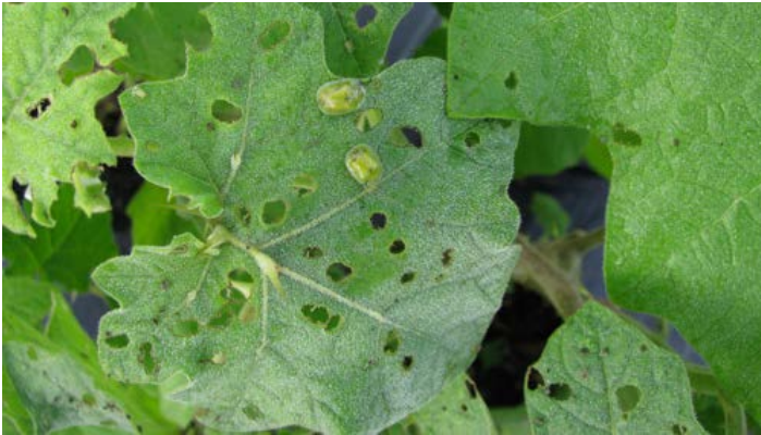
Figura 8. Hojas de tropical soda apple mostrando el daño por 'disparo de escopeta' creado por Gratiana boliviana .

El daño por alimentación de las larvas y los adultos de Gratiana boliviana puede ser caracterizado por los orificios circulares en las hojas los cuales se parecen a un 'disparo de escopeta' y es evidente desde Abril a Noviembre. Este daño no solo reduce el área fotosintética de las hojas pero además crea heridas que podrían facilitar el ataque de enfermedades de plantas. Como resultado de este estrés acumulado, se reduce el crecimiento y reproducción de tropical soda apple. Por lo tanto, Gratiana boliviana reduce la habilidad competitiva de la maleza y así facilita indirectamente la recuperación de los pastizales y la vegetación nativa.