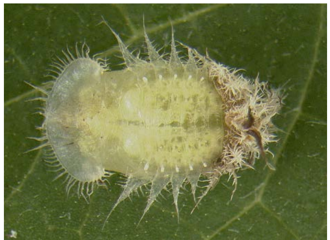
Figura 5. La pupa de Gratiانا boliviana .

Las pupas son de 5 a 6 mm de largo, de color verde pálido, aplanadas, inmóviles y tienen estructuras que parecen espinas. Las pupas se encuentran en la parte inferior de las hojas.