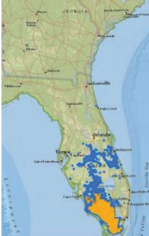
Mapa de observaciones de pumas (en azul) y su área de reproducción (anaranjado). Créditos: https://myfwc.com/wildlifehabitats/wildlife/panther/description/ .

DISTRIBUCIÓN El puma de Florida no es realmente una pantera sino una subespecie del puma norteamericano ( Puma concolor ). Esta especie está en peligro de extinción. El puma norteamericano ( Puma concolor ) es una especie con una amplia distribución geográfica que se extiende por América del Norte, Centro y Sur; desde el oeste de Canadá, a través del oeste de los Estados Unidos, y hasta el sur de Chile. Históricamente, los pumas vivían por todo Estados Unidos. Hoy en día, la subespecie de Florida representa la única población reproductiva al este del río Mississippi y está restringida a solo una población reproductiva al sur del río Caloosahatchee en Florida. Se han encontrado machos al norte del río, y un individuo se documentó tan al norte como Georgia en 2008. En 2017, se documentaron dos hembras al norte del río Caloosahatchee por primera vez desde 1973.