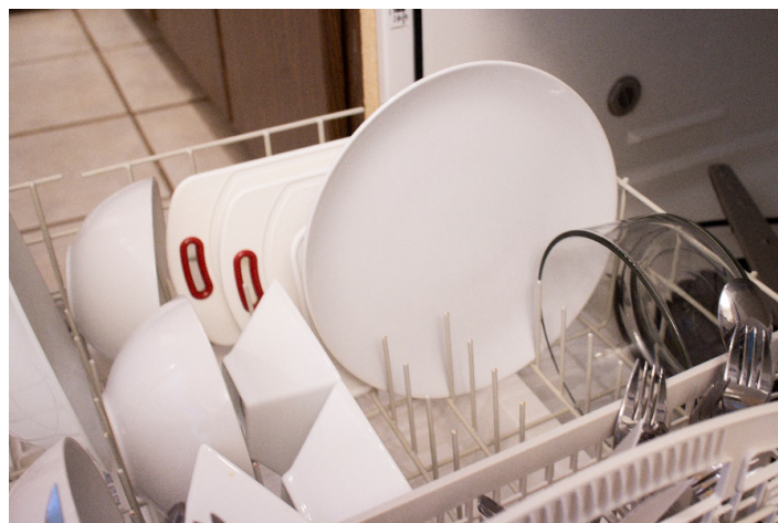
Figura 2. Platos en un lavavajillas.