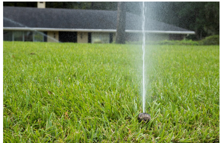
Figura 1. Riego automatizado subterráneo en una vivienda unifamiliar aislada en Florida.

Luego, para ayudar a los lectores a visualizar la magnitud del agua usada, comparamos el uso de agua en un solo ciclo de riego con otros usos típicos de agua en el interior de una residencia.