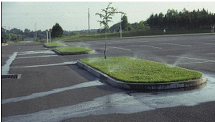
Figura 2. Asegúrese de que los sistemas de riego apliquen agua al césped y no al pavimento.

Al verificar si hay cabezales de aspersores dañados, debe reemplazar los que tengan fugas o no proporcionen una cobertura uniforme. También debe verificar que las válvulas se abran y cierren correctamente.