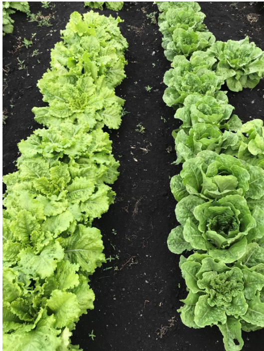
Figura 4. Introducción de planta (PI) 358001-1 (izquierda), germoplasma resistente a la raza 1 de las cepas de Florida de X. hortorum pv. vitians y UF/IFAS línea avanzada de mejora en lechuga romana (derecha) con resistencia a al patógeno cultivadas cerca de Belle Glade, FL.

de mejoramiento de lechugas de UF/IFAS está desarrollando múltiples cultivares de lechuga de diferentes tipos con resistencia contra esta enfermedad para su cultivo en Florida.