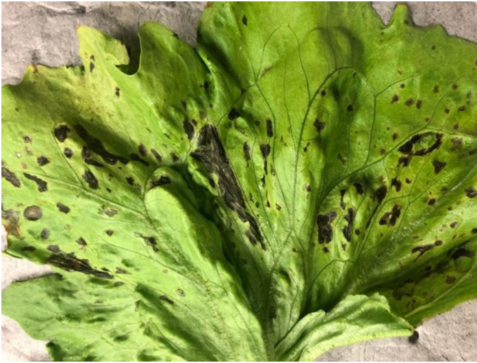
Figura 3. Síntomas avanzados de la mancha foliar bacteriana en lechuga iceberg en material colectado cerca a Belle Glade, FL.