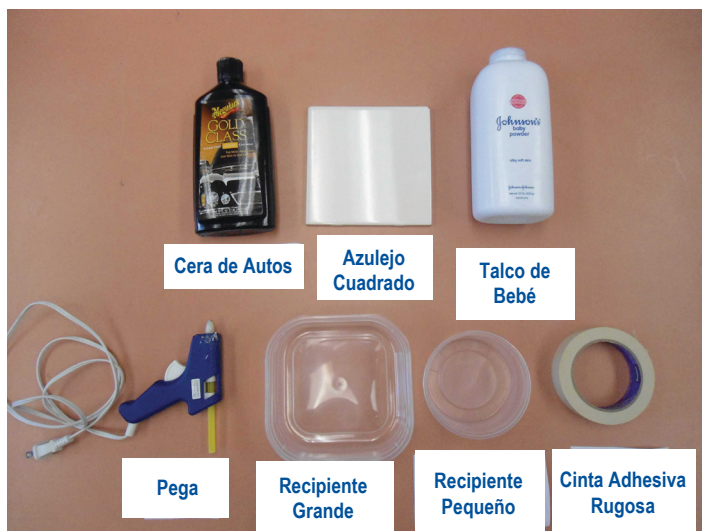
Figura 1. Artículos necesarios para hacer una sola trampa interceptora de chinches de cama. Desde la izquierda a la derecha y desde arriba hacia abajo: cera de autos, azulejo cuadrado, polvo de bebé, pega, recipiente grande, recipiente pequeño, cinta adhesiva de superficie rugosa.