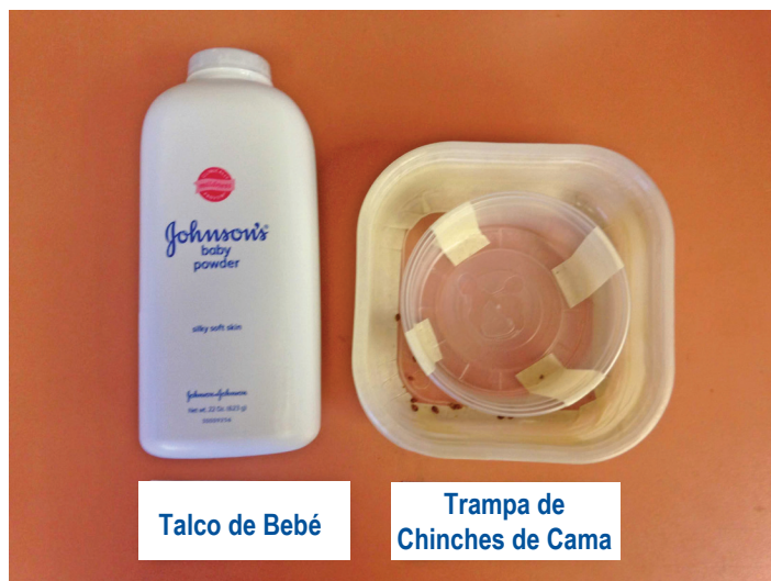
Talco de Bebé

5. Asegúrese que las superficies estén lisas para que las chinches de cama no se puedan escapar. Opción: Aplique cera de autos o polvo de talco en el lado interior del lado más grande y exterior del recipiente más pequeño. Siga las instrucciones de uso de la botella de cera de autos sobre cómo aplicar y pulir el producto. Si se utiliza el polvo de talco, no toque con las manos la superficie de la trampa espolvoreada. El polvo de talco puede ser re-aplicado según sea necesario.