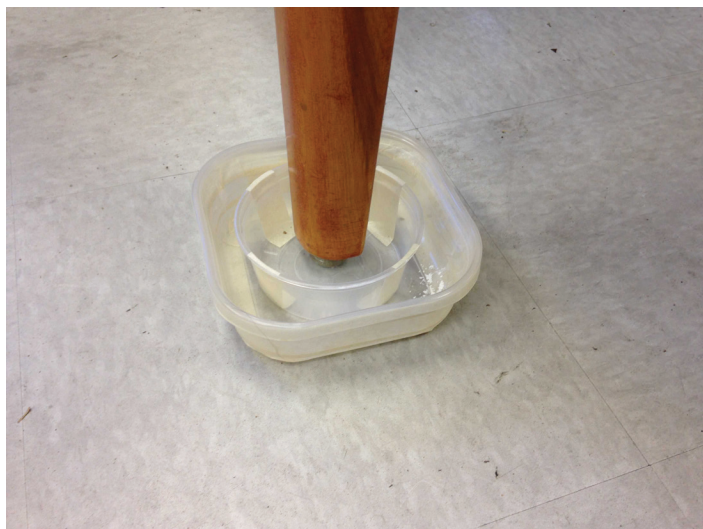
Figura 10. Una trampa interceptora colocada debajo de una pata de una pieza de mueble.

6. Mueva el mueble a ser protegido lejos de las paredes y otros muebles, y coloque una trampa debajo de cada una de sus patas. Con las camas, la ropa de cama no debe tocar el suelo, las paredes, u otros muebles.