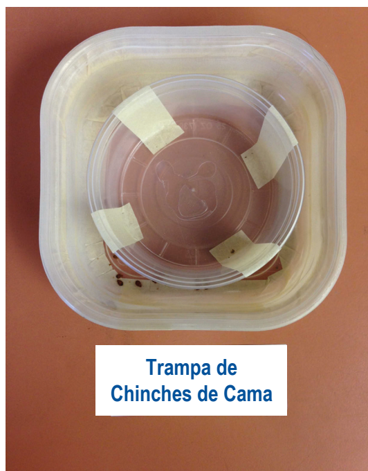
Trampa de Chinches de Cama

4. Pegue el recipiente más pequeño en el centro de la parte inferior del recipiente más grande.