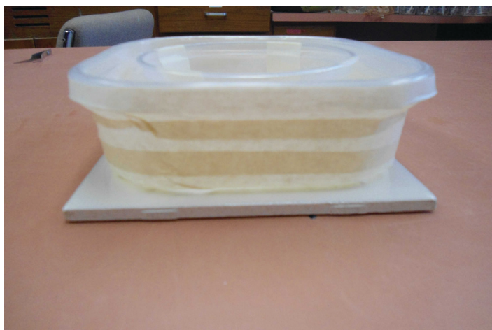
Figura 11. Un azulejo cuadrado colocado debajo de una trampa interceptora.

Opción: Sobre el piso alfombrado, coloque un cuadrado de madera contrachapada debajo de la trampa para evitar que la trampa se rompa bajo el peso del mueble.