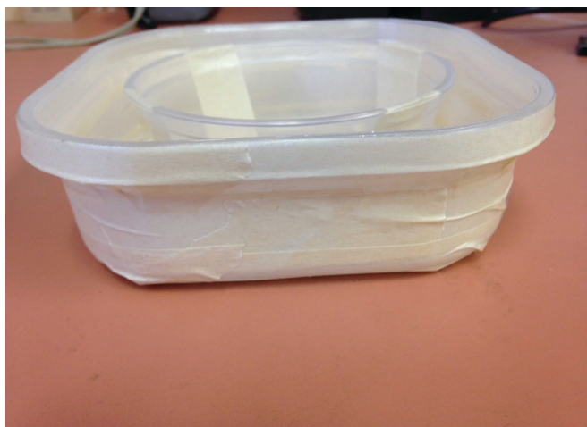
Figura 5. La cinta de superficie rugosa ha sido pegada firmemente alrededor del recipiente grande. Es importante que la cinta sea envuelta herméticamente y que no se creen grietas o hendiduras en donde las chinches de cama puedan esconderse.

4. Pegue el recipiente más pequeño en el centro de la parte inferior del recipiente más grande.