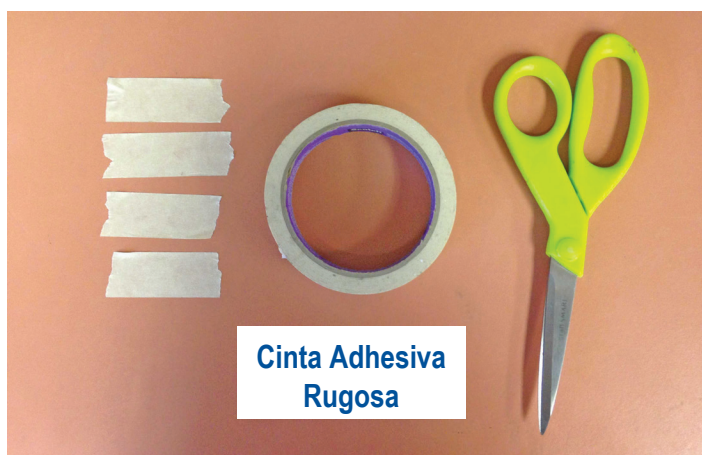
Figura 2. Cuatro pedazos de cinta adhesiva de superficie rugosa cortadas para que igualen la altura de la pared del recipiente pequeño.