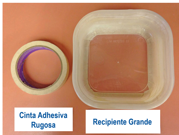
Figura 4. Cinta adhesiva de superficie rugosa y un recipiente grande se necesitan para el paso #3.