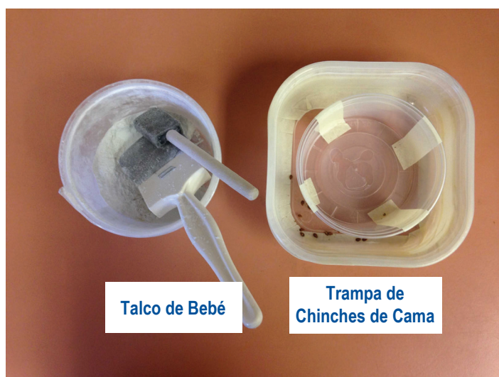
Talco de Bebé