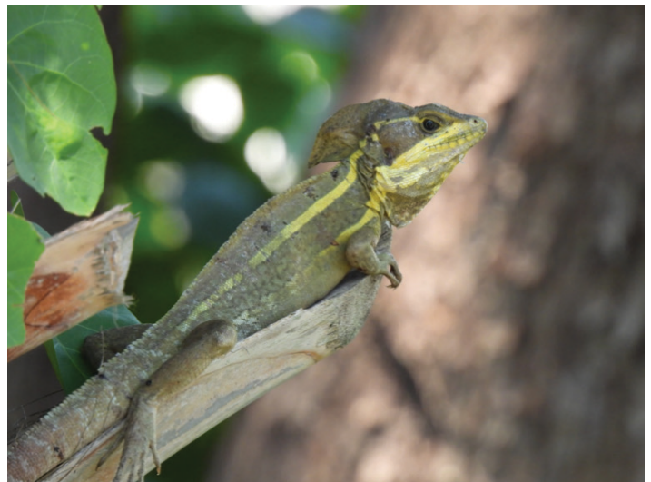
Figura 3. Basilisco marrón macho adulto mostrando la cresta de la cabeza bien desarrollada y sus distintivas rayas laterales.