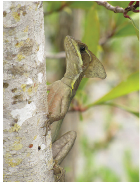
Figura 1. Basilisco marrón adulto. Note la cresta en su cabeza, la cual puede ser observada en ambos machos y hembras de esta especie, aunque usualmente se desarrolla más en los machos.

de casco, lo cual hace referencia a la cresta distintiva que poseen estos lagartos (Figura 1).