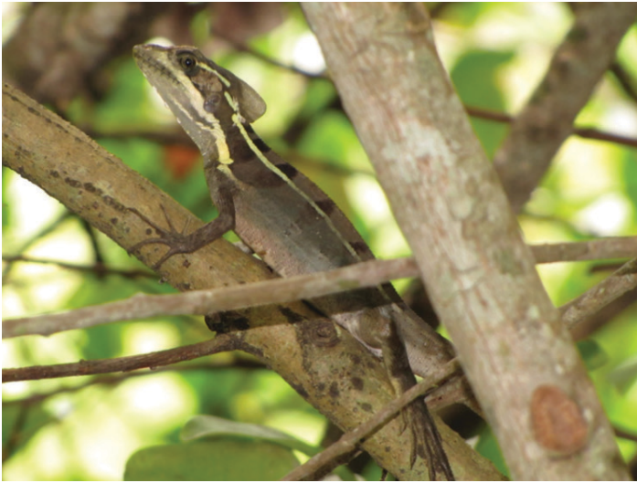
Figura 4. Basilisco marrón hembra adulta. Las hembras y los juveniles de esta especie tienen bandas oscuras en la espalda y los costados.