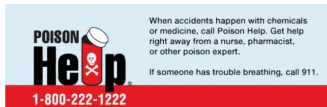
Figure 3. Cuando accidentes suceden con químicos o medicamentos, llame Ayuda Veneno (Poison Help) al 1-800-222-1222. Si alguien tiene dificultades para respirar, llame al 911. Créditos: Departamento de Servicios y Recursos Humanos de los Estados Unidos.