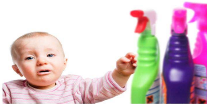
Figure 1. Los niños son curiosos por naturaleza, por lo tanto es necesario mantener los productos de limpieza, pesticidas para el hogar, y cualquier otra cosa que contenga químicos peligrosos fuera de su alcance.

sido tratadas, y frecuentemente se involucran en contacto mano-boca (Figura 1).