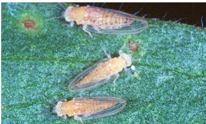
Figura 2. Psílidos adultos de Boreioglycaspis melaleucae Moore.

son usualmente verde pálido con una mancha oscura distintiva entre ellos, no obstante varios tonos de rojo han sido observados en el laboratorio; sus tres ocelos son de color naranja intenso, de los cuales los dos ocelos dorsales son más notorios. Dos apéndices con forma de dedos o 'genas' se extienden desde la parte baja de los ojos hacia afuera y apuntando ligeramente hacia abajo. Cuando están descansando o alimentándose, el cuerpo está paralelo a la superficie de la hoja o el tallo, a diferencia del psílido Asiático de los cítricos, Diaphorina citri , que mantiene su cuerpo en un ángulo de 45 grados.