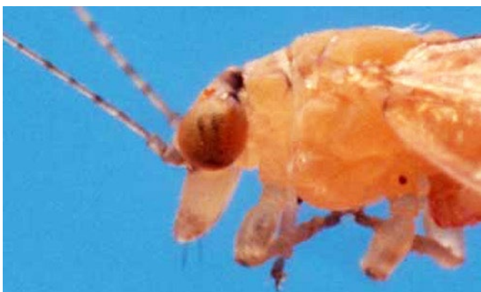
Figura 3. Vista lateral de la gena del psílido, Boreioglycaspis melaleucae Moore.

Los machos y hembras pueden ser fácilmente reconocidos por la forma de los abdómenes y por los genitales del macho. El abdomen del macho tiene la forma de un triángulo isósceles alargado cuando es visto desde arriba y terminado en unas tenazas (paramero) muy particulares, los cuales son muy aparentes cuando se los mira lateralmente. El abdomen de la hembra es más rectangular, disminuyendo gradualmente hacia la punta; las membranas pleurales son usualmente expandidas, parcialmente visibles desde arriba, llenos de huevos. Las hembras son generalmente