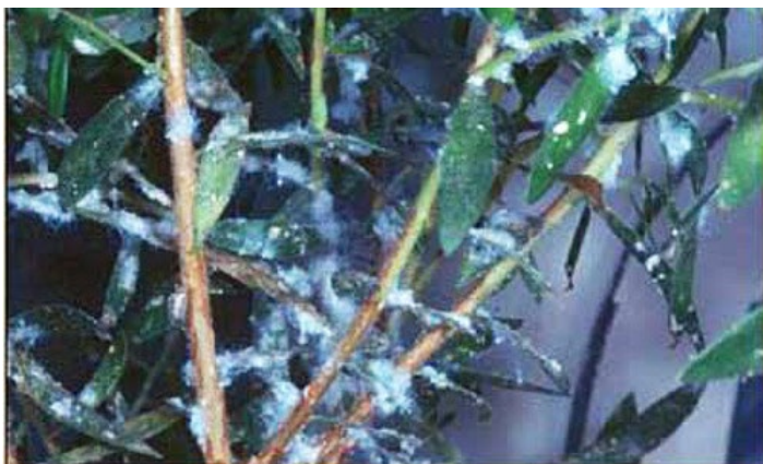
Figura 6. Tallos y hojas de melaleuca cubiertos de floculencia cerosa blanca producida por una infestación severa de ninfas del psílido Boreioglycaspis melaleucae Moore.