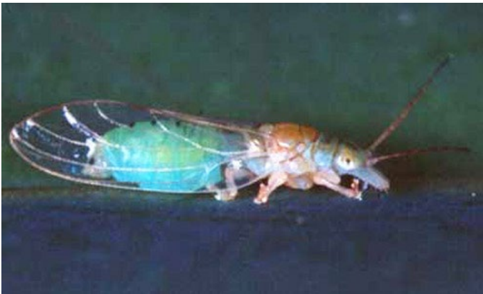
Figura 9. Hembra del morfotipo verde del psílido Glycaspis brimblecombei .