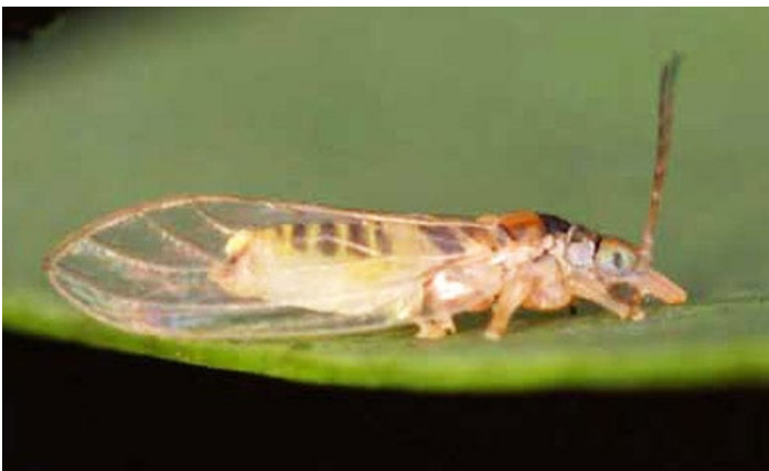
Figura 10. Hembra del morfotipo marrón del psílido Glycaspis brimblecombei Moore.

Los adultos muertos se pueden separar con la siguiente clave: