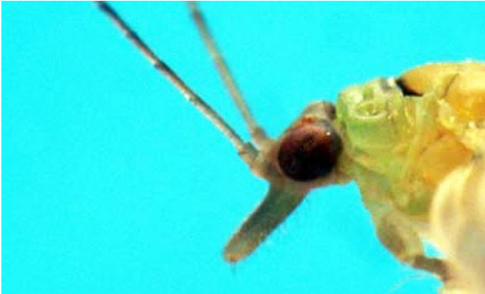
Figura 8. Vista lateral de la gena del psílido Boreioglycaspis melaleucae Moore.

invasiva, Glycaspis brimblecombei Moore, encontrada en Eucalyptus introducido (Halbert et al. 2001). Cuando están vivos, el morfotipo de color verde no será confundido con Boreioglycaspis melaleucae , pero el morfotipo de color marrón si podrá ser confundido. Cuando están muertos, los morfotipos de Glycaspis brimblecombei son más similares y podrán ser confundidos con Boreioglycaspis melaleucae .