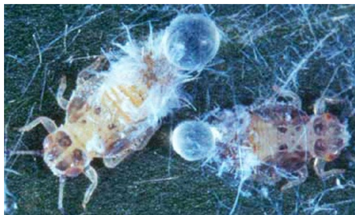
Figura 4. Ninfas mayores del psílido, Boreioglycaspis melaleucae Moore secretando mielecilla. La floculencia ha sido removida artificialmente.

Las ninfas, excepto los neonatos (insectos recién nacidos), son sedentarias salvo cuando son perturbadas. Durante los primeros estadios de desarrollo son amarillo pálido sin marcas, pero para el quinto estadio ellos tienen marcas grises a negras en el cuerpo. Cuando se alimentan, las ninfas secretan filamentos blancos cerosos desde la placa caudal dorsal. La cera filamentosa cubre ligeramente sus cuerpos. Las ramas y hojas se cubren con estos filamentos creando una floculencia (como unos puños de hebras o lana de oveja) que indican una alta infestación. La lluvia lava la floculencia, pero las ninfas secretan más eventualmente. Además, las ninfas producen cantidades abundantes de mielecilla la cual es contenida externamente en membranas globulares cerosas; las ninfas desechan esferas llenas de mielecilla en lugares cercanos. Los adultos también secretan esferas de mielecilla, pero ellos las esparcen más lejos de su área cercana.