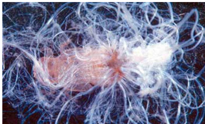
Figura 5. Ninfa del psílido Boreioglycaspis melaleucae Moore exudando hilos filamentosos cerosos.