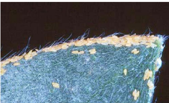
Figura 7. Huevos del psílido Boreioglycaspis melaleucae Moore, en el borde de la hoja de melaleuca.

Los huevos son de color pálido a amarillo intenso y son depositados individualmente o en grupos en las hojas y tallos de melaleuca. Los huevos están sostenidos por una proyección delgada o pedicelo el cual es insertado en la hoja.