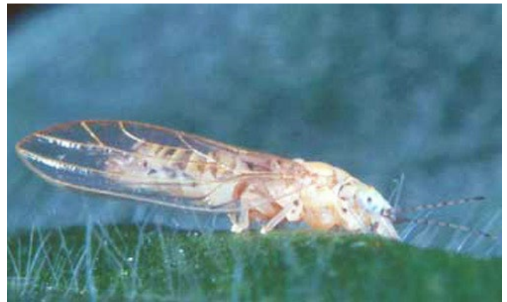
Figura 1. Vista lateral de una hembra del psílido, Boreioglycaspis melaleucae Moore.

condados en el centro y sur de Florida donde se encuentran las infestaciones de melaleuca.