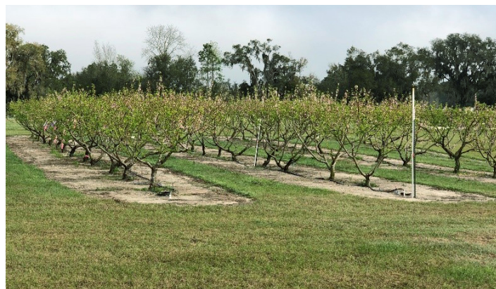
Figura 5. Huerto de duraznos en la granja de investigación de la Universidad de Florida ubicada en Citra.

et al. 1991). Se debe seguir un programa integrado de manejo de plagas para asegurar una buena calidad de la fruta. Aunque algunas enfermedades e insectos pueden ser graves, generalmente se pueden controlar con un programa de manejo de plagas adecuado. Una guía de manejo de enfermedades y plagas está disponible en línea en https://secure.caes.uga.edu/extension/publications/files/pdf/B%201171_12.PDF . Hay más información disponible sobre duraznos y duraznos en el sitio web de la Universidad de Florida ( http://hos.ufl.edu/extension/stonefruit ) y en su oficina local de UF/IFAS Extensión.