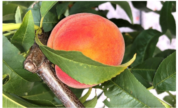
Figura 1. ‘UFSun’ durazno.

El suave clima invernal de Florida y el comienzo de la temprano de primavera ofrecen oportunidades únicas para la producción de duraznos y nectarinas de temporada temprana. Actualmente, Florida produce algunos de los duraznos y nectarinas de florecida temporada para producción comercial en América del Norte (Figura 1). Por ejemplo, los duraznos ‘UFSun’ y ‘UFBest’, que están adaptados a la Florida central y sur-central, tienen un período de desarrollo de la fruta (FDP) desde la floración hasta la cosecha de aproximadamente 80 días. Cuando se cultiva en el centro-sur de Florida, la fruta madura a principios de abril y es uno de los primeros duraznos comerciales en madurar en América del Norte. Varios otros cultivares de durazno y nectarinas adaptados al centro-sur y norte de Florida maduran poco después. Durante los últimos 12 años, la Universidad de Florida ha lanzado muchos cultivares nuevos de durazno y nectarina (Tabla 1). Estos nuevos y mejorados cultivares han aumentado el potencial de expansión del aspecto comercial de melocotones y nectarinas en gran parte de la península de Florida y en las regiones de la Costa del Golfo del sureste de los Estados Unidos.