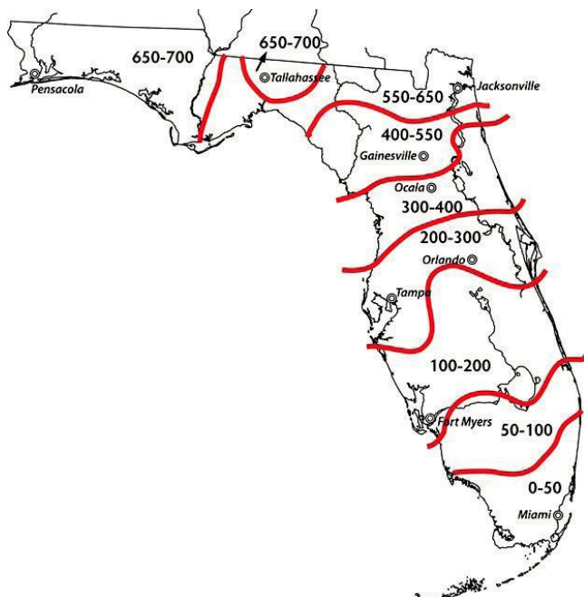
Figura 2. Las unidades de enfriamiento acumuladas (entre 32°F y 45°F) hasta el 10 de febrero en el 75% de los inviernos.