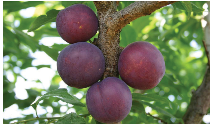
Figura 3. ‘Gulfbeauty’ antes de la maduración final del color.

ciruelas frescas disponibles. Los árboles son vigorosos con tallos altos y semi-extendidos. En ausencia de condiciones de congelación, se requiere hacer un raleo para obtener un tamaño adecuado y evitar que las ramas se quiebren. Los árboles son muy resistentes al chancro bacteriano y moderadamente resistentes al escaldado de las hojas de ciruela.