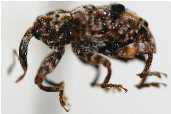
Figura 13. Hembra adulta del curculio de ciruela.

ingresará al material gelatinoso del embrión de la semilla y se alimentará (Figura 15). La ciruela pequeña se volverá rojiza y caerá del árbol. Si el gusano no alcanza la semilla antes del endurecimiento del hueso, formará un túnel alrededor de este y luego emergerá. El túnel almacenará el excremento de color marrón y la lesión aumentará las posibilidades de que la fruta madure prematuramente y se pudra. Cuando el gusano sale de la fruta, se convertirá en pupa en el suelo y emergerá como adulto en tan solo 60 días y continuará el ciclo. Los gusanos de las generaciones futuras pueden continuar el ciclo en la fruta cosechada y volverla inservible (Figura 16).