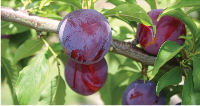
Figura 9. Fruta 'Gulfruby'.

enfermedad puede causar chancros en la madera y daños significativos en las hojas conduciendo a la defoliación, lo que puede provocar quemaduras solares en la fruta debido a la pérdida de hojas.