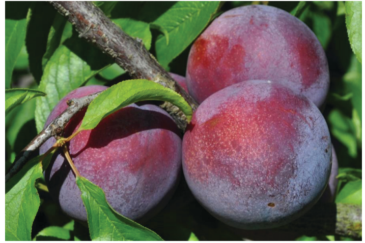
Figura 7. Fruta joven 'Gulfrose'.

'Gulfrose' también está patentado por la Universidad de Florida y madura aproximadamente una semana más tarde que 'Gulfblaze', con un período de desarrollo de la fruta de 95 días (Figura 7). El requisito de enfriamiento es de aproximadamente 275 horas. Los frutos son casi redondos, semi-freestone, de tamaño promedio (1 7/8 a 2 pulgadas de diámetro) y pesan de 70 a 80 gramos. La piel es de color púrpura rojizo oscuro, y la carne es de color rojo sangre (Figura 8). La calidad de la fruta es alta con buena firmeza y vida útil. La fruta tiene una carne dulce, aromática y una piel moderadamente agria. No hay un resabio amargo común en otras ciruelas de sangre como 'Mariposa'. Las cualidades de floración, polinización, cuajado de fruta y maduración son las mismas que para las de 'Gulfbeauty'. Los árboles son moderadamente vigorosos, semi-extendidos y precoces, y producen el segundo año después de la plantación. 'Gulfrose' tiene una resistencia similar a la bacteriosis como 'Gulfbeauty'; sin embargo, es menos tolerante a la escaldadura de las hojas de ciruela que 'Gulfblaze' con una susceptibilidad similar a 'Gulfgold', lo que limita la longevidad de los árboles.