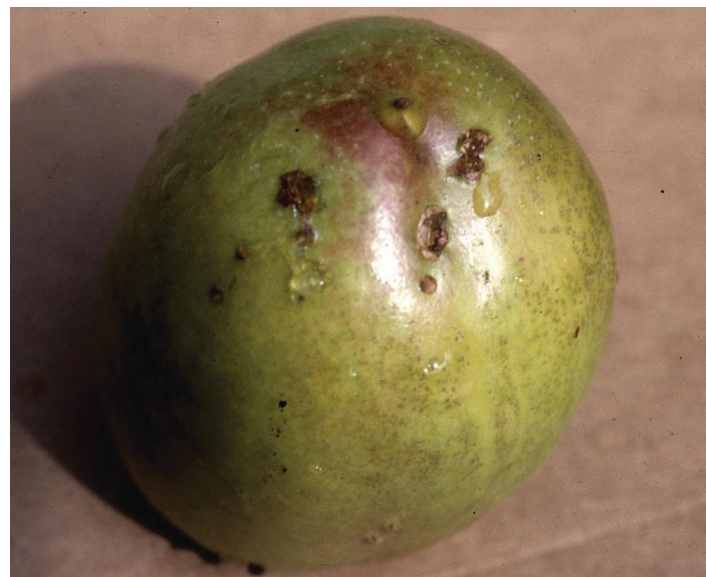
Figura 16. Múltiples cortes para la puesta de huevos.

Si el curculio ha comido porciones a lo largo de los bordes de las hojas de ciruela o áreas de la fruta pequeña, esto puede ser otro indicador de la aparición de adultos del curculio de ciruela. Los insectos generalmente comienzan