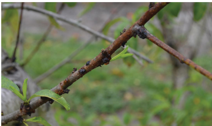
Figura 20. Gomosis en durazno causada por Botyrosphaeria dothidea .

La gomosis fúngica es causada por Botyrosphaeria spp. y es una enfermedad fúngica que causa gummosis en el tronco y las ramas de soporte (Figura 20). Esta enfermedad se puede minimizar manteniendo un buen saneamiento. Elimine toda la fruta en la cosecha y elimine toda la madera de poda del entorno del huerto porque este organismo puede esporular a partir del tejido vegetal en descomposición. Para obtener más información sobre la gomosis fúngica en el duraznero, consulte Fungal Gummosis in Peach en https://edis.ifas.ufl.edu/hs1265 .