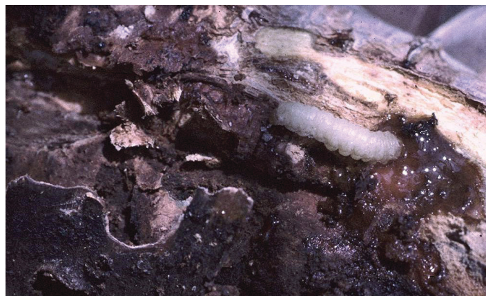
Figura 19. Barrenador menor del durazno con túneles y gomas que contienen excremento.

color naranja a rojo. Los enemigos naturales (incluyendo una especie de mariquita importada, Harmonia acyridis ) a menudo pueden mantener los ácaros bajo control. Los pesticidas para control no deben considerarse a menos que las poblaciones acumulen más de 10 ácaros por hoja. Las recomendaciones de aspersión se pueden encontrar en Insect Management in Peaches en https://edis.ifas.ufl.edu/ig075 o en la Guía de cultivo y manejo de plagas de durazno, nectarina y ciruela del sureste ( https://secure.caes.uga.edu/extension/publications/files/pdf/B%201171_12.PDF ).