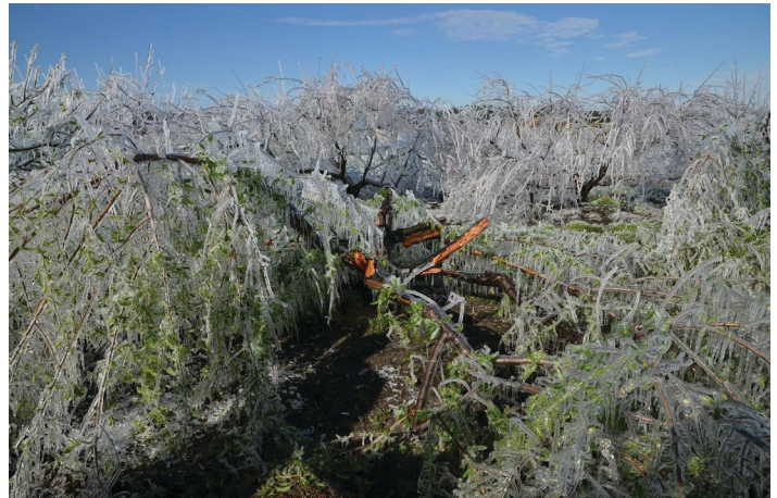
Figura 12. Protección contra congelamiento con riego por aspersión, que muestra las ramas dobladas y divididas por el peso del hielo.

el volumen de agua debe ser de al menos 1/3 pulg. por hora para velocidades de viento inferiores a 10 mph. Si no se aplica suficiente agua, o los rociadores no proporcionan una cobertura adecuada, entonces la cantidad de daño por congelamiento puede ser mayor que si no se hubiera aplicado agua. Las desventajas de controlar la congelación con riego incluyen el rompimiento de las ramas del andamio (Figura 12) y de los brotes con el peso del hielo, el uso de una gran cantidad de agua aplicada al área y la inversión en grandes pozos de agua y en combustible (diésel), que es más confiable que la energía eléctrica. Se puede encontrar una discusión más exhaustiva sobre la protección contra congelamiento en Protecting Blueberries from Freezes in Florida en https://edis.ifas.ufl.edu/hs216 .