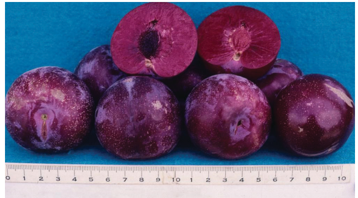
Figura 8. Fruto 'Gulfrose' que muestra el color de la pulpa y la piedra de hueso.

'Gulfruby' se originó en el programa de fitomejoramiento de la Universidad de Florida, pero no fue lanzado por la universidad debido a su susceptibilidad a la bacteriosis. Fue propagado por primera vez junto con 'Gulfgold' en 1982 por el vivero de Grand Island en Umatilla, Florida. No está patentado, por lo tanto, es una variedad pública. La bacteriosis ocurre fácilmente en las hojas y ramitas de 'Gulfruby' y se ve agravado por las frecuentes lluvias de verano. En general, el árbol puede sobrevivir de 5 a 8 años y proporcionar varios cultivos de ciruelas de maduración temprana. Las frutas son de tamaño mediano, de hasta 2 pulgadas de diámetro y tienen forma redonda (Figura 9). La carne es dulce, de color amarillo con un tinte verdoso, y se adhiere a la semilla pequeña en la madurez cuando el fruto es suave. El color de la piel es rojo a púrpura con características agrias. La fruta colgará en el árbol de 3 a 5 días después de que se desarrolle el color rojo completo de la piel y madurará de 7 a 10 días antes de 'Gulfblaze'. El árbol no es tan vigoroso ni posee tantas de las fuertes tendencias de tiro vertical de 'Gulfbeauty'. 'Gulfruby' tiene más problemas con la bacteriosis que los otros cultivares de bajo enfriamiento recomendados para ensayar. La