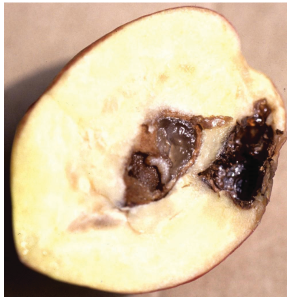
Figura 15. Larvas de curculio comiendo el embrión. Pudrición en el punto de entrada, con gomosis.

la separación de la cáscara, cuando los sépalos y los pétalos son empujados por la fruta en crecimiento, también puede usarse para indicar que las hembras están presentes y están comenzando a poner huevos. En ciruelas silvestres, las poblaciones de curculio del ciruelo están presentes y siguen un ciclo natural. La separación de la cáscara generalmente coincide con la aparición del curculio, por lo que observar las ciruelas silvestres durante el inicio de este evento, puede ayudar a cronometrar las aplicaciones de insecticidas.