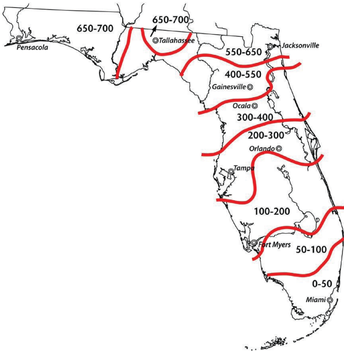
Figura 1. Promedio de acumulación de unidades de frío durante el invierno (32°F–45°F) para el estado de Florida en el 75% de los inviernos.

Aunque las ciruelas de la serie ‘Gulf’ tienen un bajo requerimiento de enfriamiento, necesitan días más cálidos que los duraznos de bajo enfriamiento para romper la latencia invernal. Esta condición se conoce como un requisito de calor, que es un período de temperaturas nocturnas superiores a 55°F y temperaturas diurnas superiores a 65°F. Para la serie de ciruelas ‘Gulf’, se requieren 1–2 semanas de estas condiciones para tener una brotación uniforme. Durante la mayoría de los inviernos en Florida, las ciruelas de la serie ‘Gulf’ no florecen lo suficientemente temprano como para ser demasiado susceptibles a la escarcha o a las heladas al final del invierno o principios de la primavera. Del mismo modo, no muestran síntomas de enfriamiento inadecuado, como floración o hojearo tardío que puede conducir a una reducción de la producción de fruta o la ausencia de fruta.