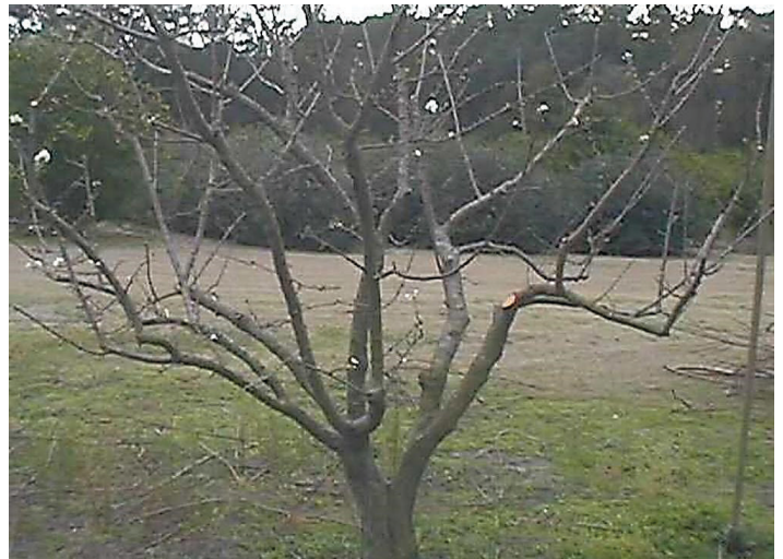
Figura 11. Árbol podado con algunas extremidades centrales eliminadas, altura reducida y extremidades inferiores eliminadas.

Idealmente, la fruta debe estar separada de 3 a 6 pulgadas. Si el cultivo es ligero, solo se debe retirar el exceso de fruta de grupos pesados. Dado que las ciruelas tienen un largo período de floración y múltiples oleadas de frutos, el raleo se debe hacer varias veces. El raleo no debe iniciarse hasta que haya pasado el peligro de temperaturas de congelación a fines del invierno/principios de la primavera.