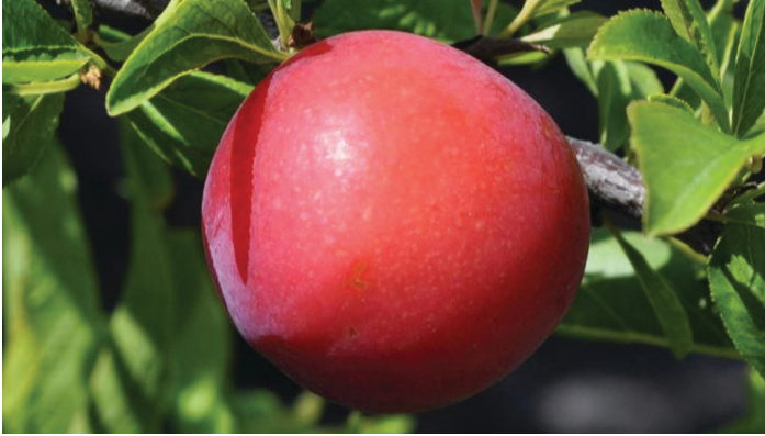
Figura 5. Fruta joven 'Gulfblaze'.

polinización, cuajado y maduración son las mismas que para 'Gulfbeauty'. Las hojas, los tallos y los frutos tienen una resistencia similar a la bacteriosis y a la escaldadura de las hojas de ciruela como 'Gulfbeauty'.