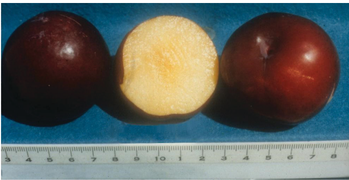
Figura 6. Fruta 'Gulfblaze' que muestra el color de la carne. Escala en centímetros.

'Gulfrose' también está patentado por la Universidad de Florida y madura aproximadamente una semana más tarde que 'Gulfblaze', con un período de desarrollo de la fruta de 95 días (Figura 7). El requisito de enfriamiento es de aproximadamente 275 horas. Los frutos son casi redondos, semi-freestone, de tamaño promedio (1 7/8 a 2 pulgadas de diámetro) y pesan de 70 a 80 gramos. La piel es de color púrpura rojizo oscuro, y la carne es de color rojo sangre (Figura 8). La calidad de la fruta es alta con buena firmeza y vida útil. La fruta tiene una carne dulce, aromática y una piel moderadamente agria. No hay un resabio amargo común en otras ciruelas de sangre como 'Mariposa'. Las cualidades de floración, polinización, cuajado de fruta y maduración son las mismas que para las de 'Gulfbeauty'. Los árboles son moderadamente vigorosos, semi-extendidos y precoces, y producen el segundo año después de la plantación. 'Gulfrose' tiene una resistencia similar a la bacteriosis como 'Gulfbeauty'; sin embargo, es menos tolerante a la escaldadura de las hojas de ciruela que 'Gulfblaze' con una susceptibilidad similar a 'Gulfgold', lo que limita la longevidad de los árboles.