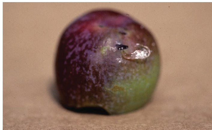
Figura 14. Corte de media luna en frutos caídos con gomosis.

Las aspersiones de insecticidas deben aplicarse cuando los adultos emergen del suelo. Las recomendaciones de aspersión se pueden encontrar en Insect Management in Peaches en https://edis.ifas.ufl.edu/ig075.pdf o en Southeastern Peach, Nectarine and Plum Pest Management and Culture Guide (Guía de cultivo y manejo de plagas de durazno, nectarina y ciruela del sureste - https://secure.caes.uga.edu/extension/publications/files/pdf/B%201171_12.PDF ). El monitoreo de las poblaciones se puede hacer con trampas de Tedder colocadas en el huerto. Eventos naturales, como