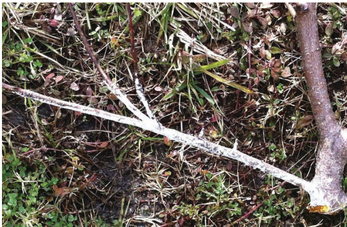
Figura 18. Población abundante de escama blanca del durazno. Observe la apariencia nevada.

de invierno cuando los árboles están inactivos, como se discutió en la sección de la escama de San José.