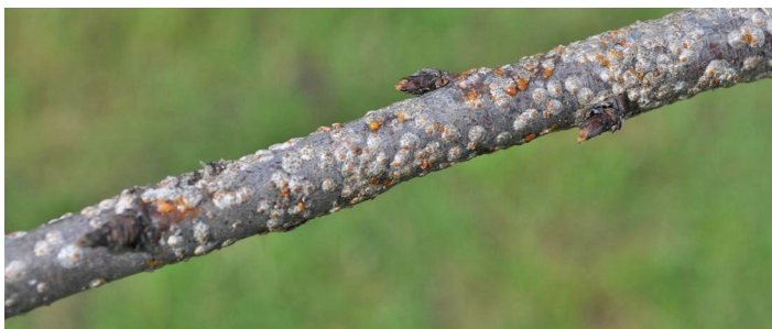
Figura 17. Escama de San José sobre la corteza con coloración roja en donde la hembra ha sondeado y se está alimentando del cambium.

La escama de San José aparece como manchas cerosas grisáceas en la corteza del árbol. A diferencia de la escama blanca del durazno que es más grande y se puede ver fácilmente a fines del verano debido a sus poblaciones masculinas blancas como la nieve, la escama de San José no es fácil de ver. Sin embargo, las poblaciones se pueden confirmar cortando un pequeño trozo de corteza en la capa cambial y observando puntos morados en la rama donde la hembra se ha estado alimentando (Figura 17).