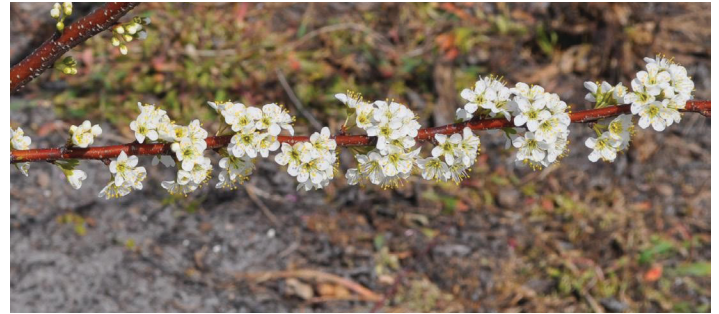
Figura 2. Flor de ciruela.

‘Gulf’ y su calidad de fruta es pobre. Los árboles para la polinización se plantan en una proporción de 1 polinizador por cada 5–8 árboles de cultivo. La capacidad de cultivo en las ciruelas ‘Gulf’ es muy alta y se debe hacer raleo (conocido también como aclareo) para obtener fruta grande y evitar que las ramas se rompan. La fruta se produce tanto en espuelas como a lo largo de los brotes de la temporada anterior. Estas ciruelas son precoces, a menudo fructifican en el segundo año después de la siembra.