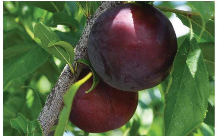
Figura 4. ‘Gulfbeauty’ mostrando color de maduración.

‘Gulfblaze’ fue lanzado y patentado por la Universidad de Florida (Figura 5). La fruta madura en medio de la temporada de ciruelas de Florida. El requisito de enfriamiento para ‘Gulfblaze’ es de aproximadamente 250 horas. La floración y la polinización cruzada ocurren con todas las otras ciruelas de la serie ‘Gulf’. El conjunto de frutas es bueno con flores formadas en espuelas y brotes de la temporada anterior. Las frutas son muy firmes, de tamaño promedio (1⅞ a 2 pulgadas de diámetro) y pesan de 70 a 90 gramos. El fruto es redondo y semi-freestone con la pulpa débilmente unida al hueso cuando madura. El color de la fruta es rojo oscuro a púrpura y la carne es naranja, dulce y subácida (Figura 6). La piel es agria, aunque la calidad general de la fruta es buena. La fruta madura de 8 a 14 días después de ‘Gulfbeauty’ con un período de desarrollo de la fruta de 95 días. Las características de floración,