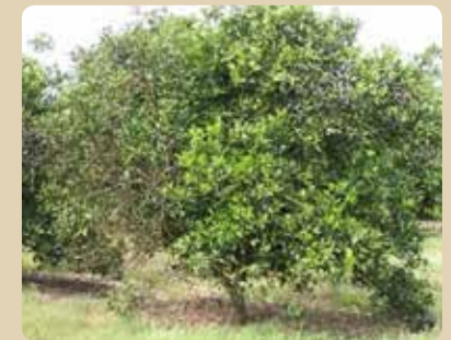
Blight infected tree with sectoring (disease symptoms are unevenly distributed) Árbol afectado por blight (síntomas no uniformes en el árbol)