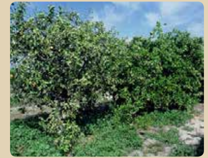
Blight tree (left) versus healthy tree (right) Árbol con blight (izquierda) comparado con uno sano (derecho)