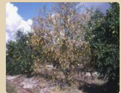
Citrus tristeza decline (on sour orange rootstock) Declinamiento por tristeza sobre pie de naranjo agrio

*To identify a blight tree, use a drill and syringe to test the water uptake (see http://edis.ifas.ufl.edu/HS241 ).