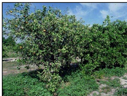
Blight tree (left) versus healthy tree (right)

*Para identificar un árbol con blight, usar un taladro y una jeringa para ensayar la absorción de agua.