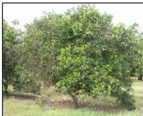
Blight infected tree with sectoring (disease symptoms are unevenly distributed)

Árbol con blight (izquierda) comparado con uno sano (derecho)