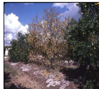
Citrus tristeza decline (on sour orange rootstock)

Árbol afectado por blight (síntomas no uniformes en el árbol)