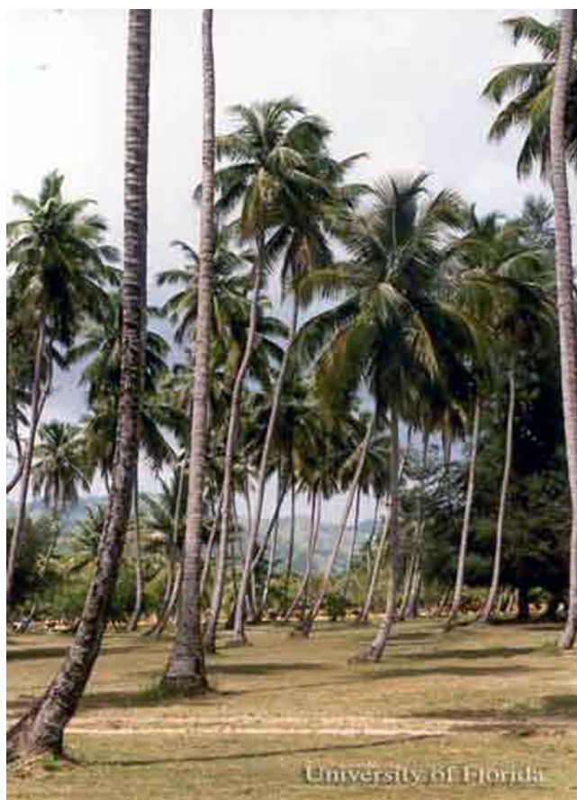
Figure 8. Palmas de coco, Cocos nucifera L. de la variedad 'Alto de Jamaica' en Playa Tres Hermanos, cerca de Añasco, Puerto Rico. Los cocos son removidos periódicamente de las palmas en el área del balneario.

Moore D, Howard FW. 1996. Coconuts. In Mite Biology, Natural Enemies,