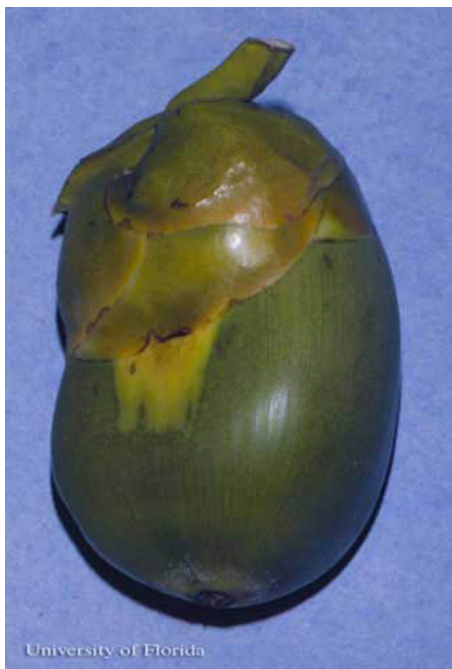
Figure 6. Daño inicial del ácaro del coco, Aceria guerreronis Keifer. Observe la zona triangular pálida.

El daño del ácaro puede ser reconocido a distancia, pero debe ser confirmado por medio de un examen más detallado. El bronceado de los cocos puede ser causado por varios factores. Primero debe notarse que los frutos del coco (cerca de 12 meses de