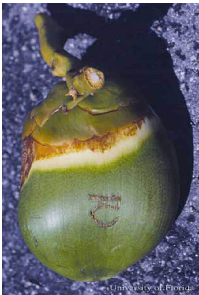
Figure 7. Daño inicial en una zona más extendida por el ácaro del coco, Aceria guerreronis Keifer.

coco y han sido vistos solo en cocos jóvenes. En un estudio que involucró un gran número de frutos de cocos en La Florida, los cuales presentaban daños atribuibles a los ácaros que se alimentaron en la zona del perianto, se encontró que el 99 % fueron infestados por ácaros del coco y solo 1 % por Tarsonemus sp.