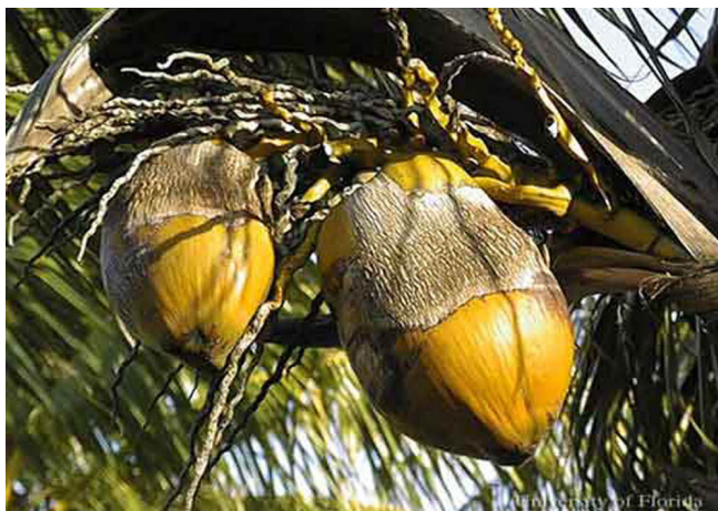
Figure 3. Cocos con daño del ácaro, Aceria guerreronis Keifer.

Probablemente los ácaros del coco se dispersan de una palma a otra por medio de las corrientes de aire, o son transportados por insectos o aves que