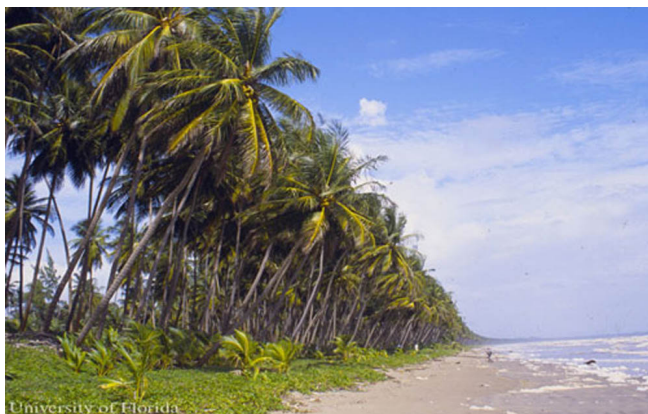
Figure 5. Palmas de coco, Cocos nucifera L., en la playa de la Bahía Manzanilla, Trinidad.

palma de coco encuentra lugar en paisajes o jardines diseñados de áreas de turismo, y a la vez son muy valoradas por muchos propietarios de casas. El daño causado por el ácaro no es fácilmente perceptible a distancia, lo que a menudo no presenta impacto significativo en la apariencia estética de las palmas en las playas y en muchos de los jardines ornamentales. Como plaga de plantas ornamentales el ácaro del coco es más importante para dueños de casas o administradores de áreas donde las palmas son vistas más de cerca, como por ejemplo jardines alrededor de piscinas de hoteles.