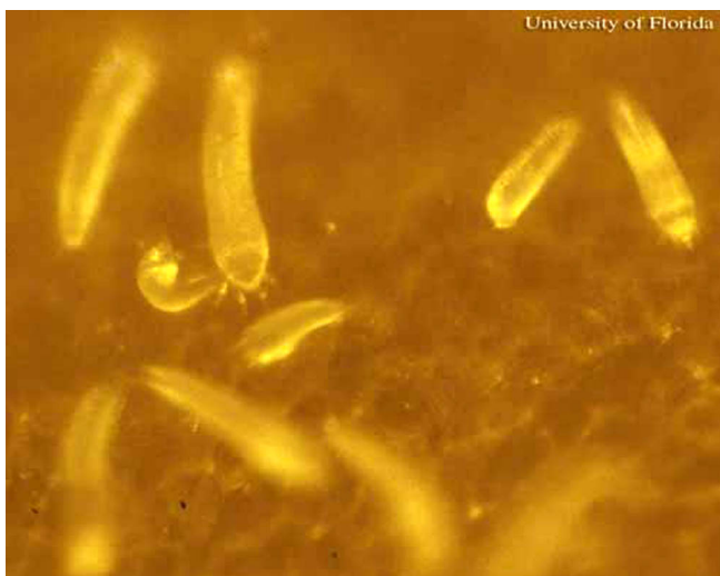
Figure 2. Colonia de Aceria guerreronis Keifer, el ácaro del coco.

aproximadamente. Las poblaciones que están debajo del perianto crecen rápidamente, a menudo produciendo miles de ácaros en cada una de las diferentes agregaciones en el mismo fruto. Las poblaciones masivas de ácaros del coco pueden estar presentes entre los tépalos o sobre la superficie del fruto y el cáliz durante los primeros seis meses de desarrollo del fruto. Luego de este período las poblaciones declinan. La maduración del fruto requiere alrededor de 12 meses. Durante los últimos meses del desarrollo del coco, pocos ácaros están presentes aún en frutos con daño severo.