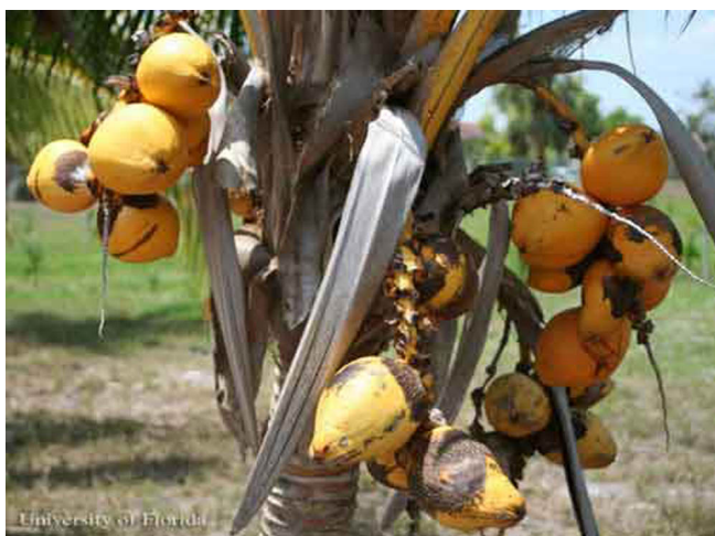
Figure 4. Una palma de coco, Cocos nucifera L., de la variedad 'Red Spicata Dwarf', con el daño del acaro del coco, Aceria guerreronis Keifer.

Las excepciones incluyen reportes de este ácaro infestando los frutos de Lytocaryum weddellianum (H. A. Wendland), y Syagrus romanzoffiana (Chamisso) Glassman. Ambas especies son palmas nativas de Sur América y ambas son palmas 'cocosoides', eso es, taxonómicamente relacionadas con la palma de coco. El primer registro de otro hospedero está basado en observaciones en una palma del área urbana de Brasil, y el segundo en observaciones de palmas jóvenes en las condiciones de vivero en California. Los ácaros del coco raramente atacan otras palmas diferentes a la de coco. Las variedades de palma de coco difieren en su susceptibilidad al ácaro, pero casi todas las variedades tienen algún nivel de susceptibilidad.