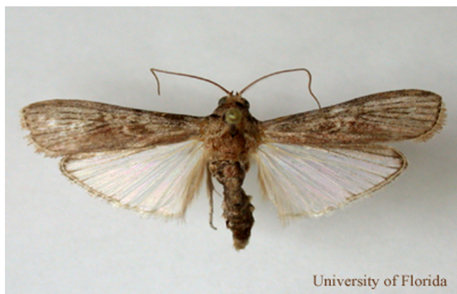
Figure 1. Taladrador de las meliáceas, Hypsipyla grandella (Zeller), polilla preservada en alfiler.

Adulto. Los adultos de H. grandella son de color de marrón a marrón-grisáceo. La envergadura de las alas anteriores es cerca de 23 a 45 mm. Estas son gris-fuscas sombreadas de color ladrillo en la parte posterior de la ala. Las áreas medias a afueras de las alas anteriores aparecen espolvoreadas con escamas y con puntos negros hacia las puntas de las alas. Las venas de las alas son recubiertas con escamas negras. Las alas traseras son blancas a translucidas con margines oscuras. La cabeza, cuerpo, y patas son de un color castaño-grisáceo.