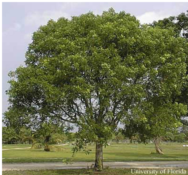
Figure 10. Caoba antillana, Swietenia mahagoni .