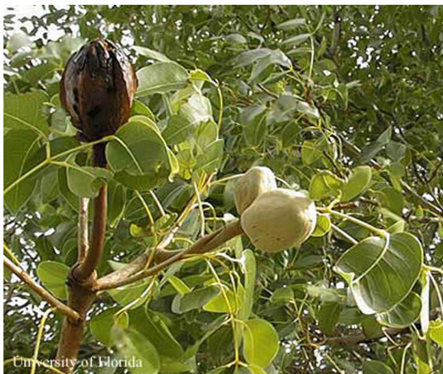
Figure 11. Caoba antillana, Swietenia mahagoni , follaje y cápsulas de semillas.