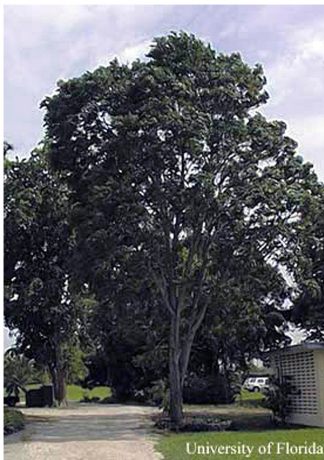
Figure 9. Cedro, Cedrela odorata .

La caoba hondureña ( S. macrophylla King), que es nativa al continente de América Tropical, ocurre en regiones húmedas tropicales desde alrededor de latitud de 22° N en el lado atlántico de México a través de Centroamérica y de Sudamérica hasta