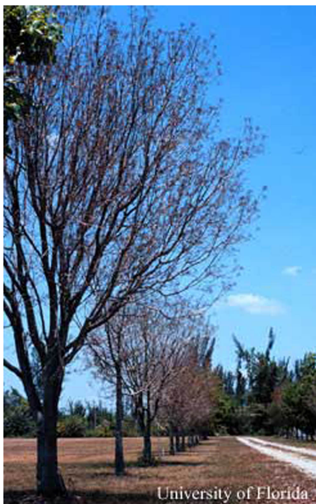
Figure 6. Caoba antillana, Swietenia mahagoni , durante el brote de la primavera.

limitado al período durante la dehiscencia de la cápsula, eso es, en la primavera antes y simultanea con la producción de nuevos brotes. (Howard and Gilblin-Davis 1997). El estadio de la pupa toma lugar adentro del brote hueco o sea en la cápsula de semillas, o ocasionalmente en la capa de hojas muertas o en el suelo debajo los árboles hospederos. El estadio de la pupa dura 8-10 días (Ramírez Sánchez 1964).