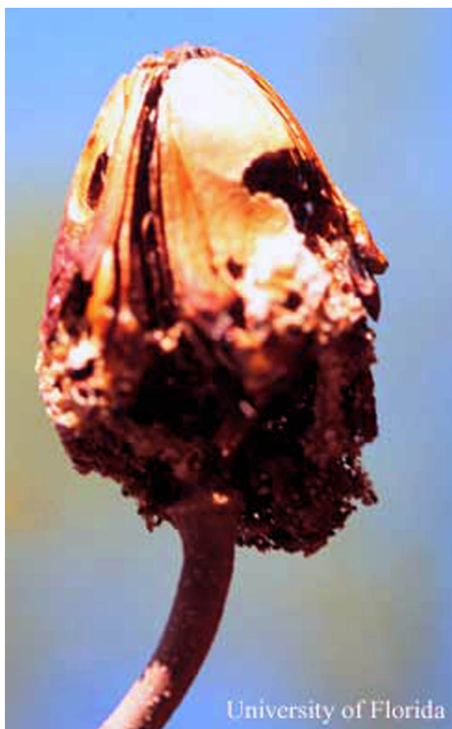
Figure 7. Caoba antillana, Swietenia mahagoni , cápsula de semillas dañado por Taladrador, de las meliáceas, Hypsipyla grandella (Zeller).

Especies de varios géneros en la familia botánica Meliaceae sirven como plantas hospederas del taladrador de las meliáceas, incluyendo Carapa , Cedrela , Guarea , Khaya , Swietenia , y Trichilia (Entwistle 1967, Becker 1976). La mayoría de las especies son nativas de los trópicos de las