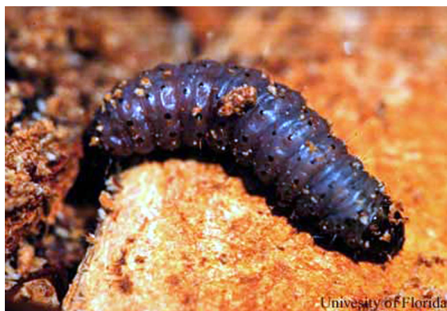
Figure 3. Taladrador de las meliáceas, Hypsipyla grandella (Zeller), larva.