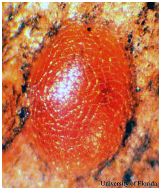
Figure 2. Taladrador de las meliáceas, Hypsipyla grandella (Zeller), huevo.

Pupa. La pupa de H. grandella es marrón-negro en color y envuelto en un cocón de seda.