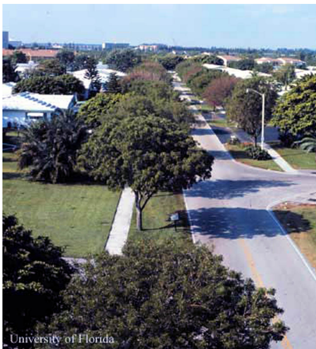
Figure 12. Caoba antillana, Swietenia mahagoni , como árbol de sombra en área urbana de la Florida.

alrededor a la latitud de 22° S en Bolivia. Es actualmente la fuente principal de la madera de caoba, pero en la Florida se encuentra ocasionalmente y solamente como un árbol de espécimen.