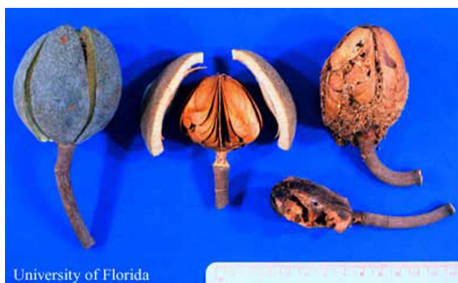
Figure 8. Caoba antillana, Swietenia mahagoni , cápsulas de semillas y partes dañados por el taladrador de las meliáceas, Hypsipyla grandella (Zeller). Izquierda a derecho: Cápsula en estado inicial de dehiscencia, cápsula no atacada, corazón dañado por larvas, cápsula abierta dañada por larvas.