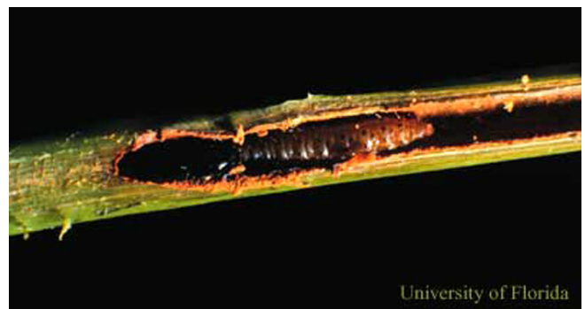
Figure 5. Tallo de caoba antillana partida para revelar larva de taladrador de las meliáceas, Hypsipyla grandella (Zeller).

El taladrador de las meliáceas también ataca las cápsulas de las semillas de las caobas, los cedros, y otros árboles meliáceos. Según observaciones sobre el ataque de este insecto en caobas antillanas en el sur de la Florida, raramente perforan las válvulas duras de las cápsulas de las semillas, sino penetran ente ellas al abrir la cápsula. En este sitio consumen las 50-80 semillas, luego penetran el corazón de la cápsula donde a veces pasan el estado de la pupa. En la Florida, el ataque del taladrador de las meliáceas sobre cápsulas de semilla de la caoba antillana esta básicamente