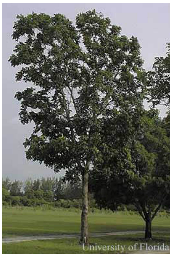
Figure 13. Caoba hondureña, Swietenia macrophylla .

La caoba del Pacífico ( S. humilis Zuccarini) se distribuye al lado de las áreas costeras Pacíficas de